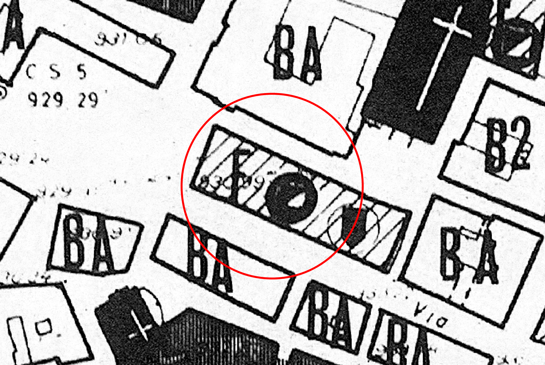
STRALCIO PRG VIGENTE