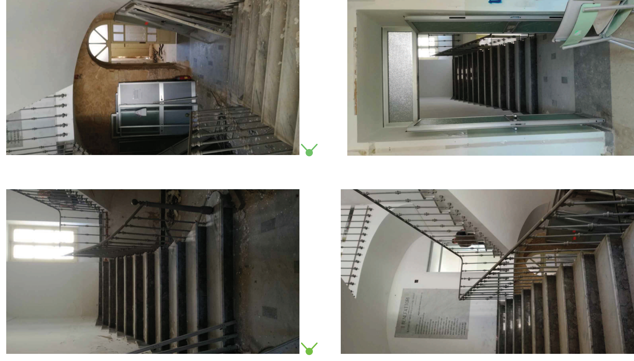
FOTO PIANO PRIMO