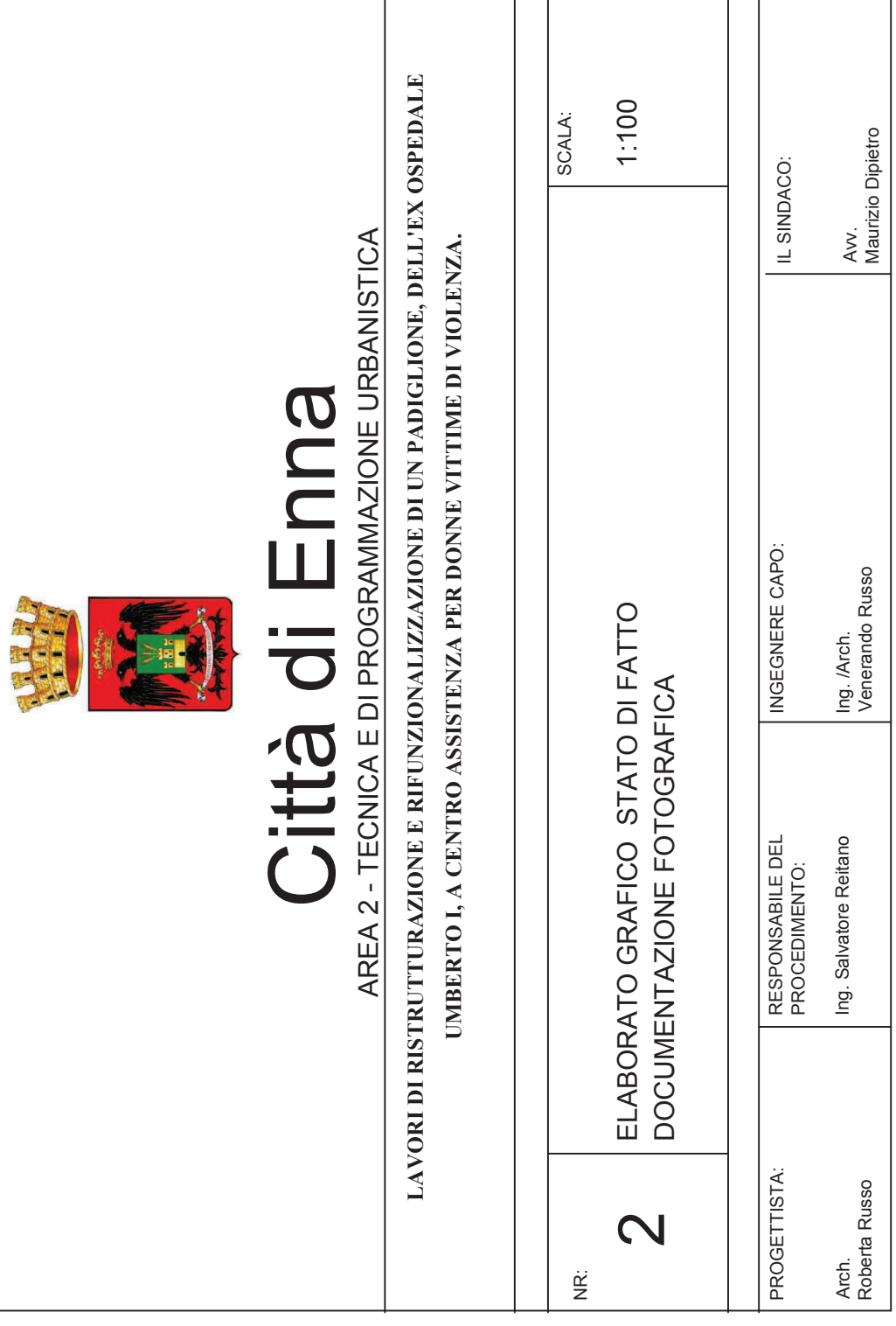
FOTO PIANO TERRA